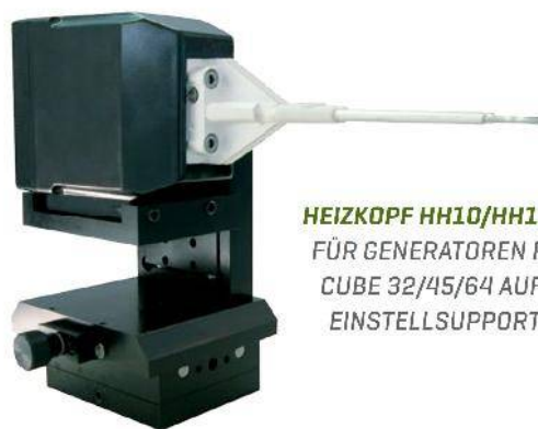
HEIZKOPF HH10/HH11 FÜR GENERATOREN POWER CUBE 32/45/64 AUF EINSTELLSUPPORT ES35

Die Verwendung von innovativen technischen Lösungen und Komponenten der neuesten Generation sorgen dafür, dass die Generatoren der Serie 900 bei Leistung und Preis führend sind.