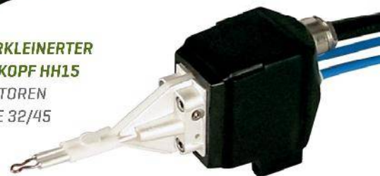
VERKLEINERTER HEIZKOPF HH15 FÜR GENERATOREN POWER CUBE 32/45

* Die auf der Abbildung dargestellten Induktoren dienen lediglich als Beispiel